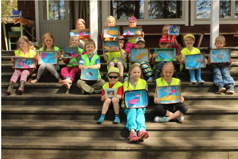
Kesällä 2015 päiväleiriläiset valmistivat ikiomat akvaariot.

Kesäkuussa lapsi - ja perhetyö tarjoaa lasten ja varhaisnuortenleirejä seurakunnan leirikeskuksessa Leiriniemessä ja kesäkerhoa seurakuntakodin lastentiloissa.